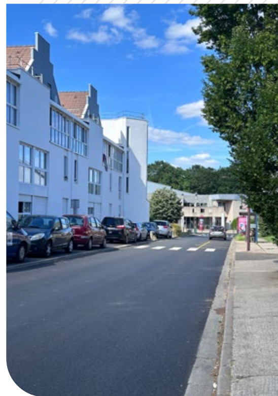
Rue de la Roseraie