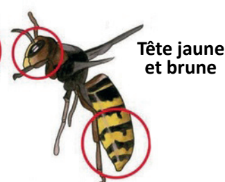
Tête jaune et brune