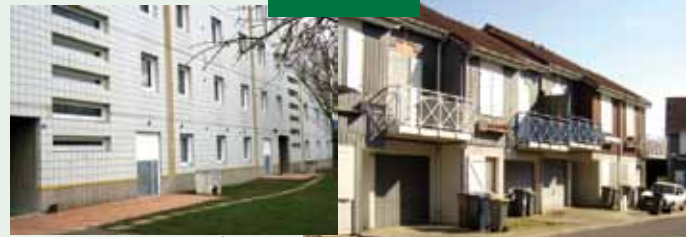
Domaxis - Quartier des Bois

Des travaux supplémentaires sont programmés et vont encore améliorer la qualité du cadre de vie des locataires. Ces travaux touchent en effet leur logement ou leur environnement direct :