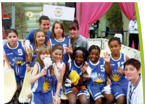
Equipe des Poussines à « l'Open Ligue ».