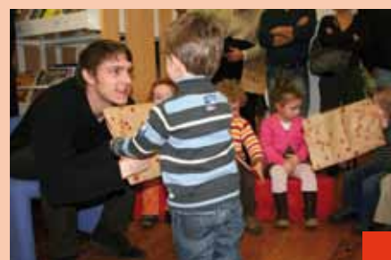
Elles viennent renouveler les bébés lecteurs des années passées... Nos petites Graines de lecteurs venues des 3 écoles de Nandy ont reçu à la bibliothèque, leur livre préféré ! (février)