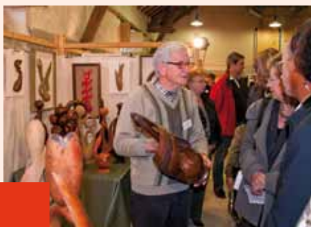
Succès renouvelé pour le 13 ème marché d'art qu'organisait l'Alliance des Arts les 27 et 28 mars derniers.