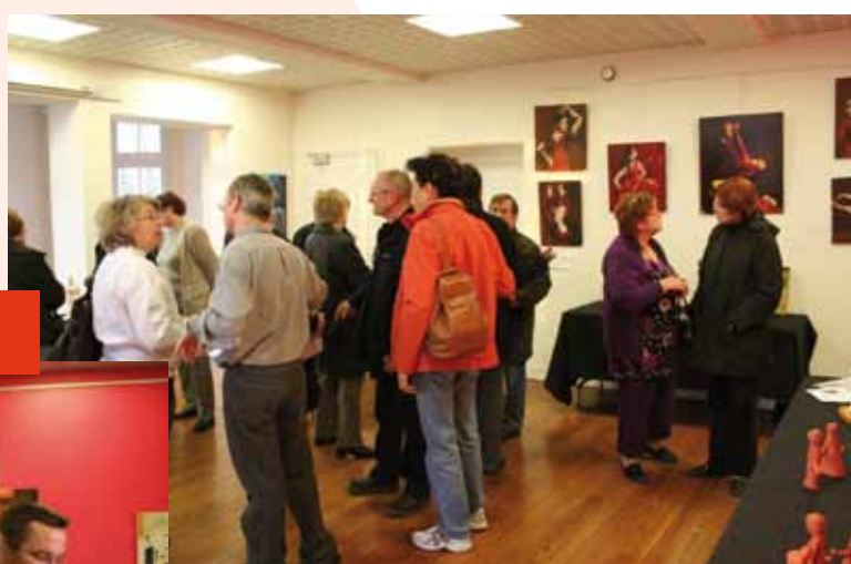
La bibliothèque recevait en mars, à l'occasion du printemps des poètes , une exposition sur le thème des femmes et de la danse , proposée par les associations du Chevalet, des Ateliers du Jeudi et de l'Alliance des Arts.