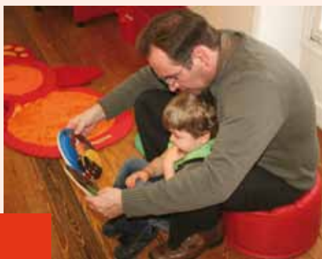
Lors de l'opération expérimentale « Premières pages » menée par la bibliothèque, grâce aux partenariats de la Caf et du Conseil général, et visant à développer le plaisir de la lecture chez les tout-petits (23.01).