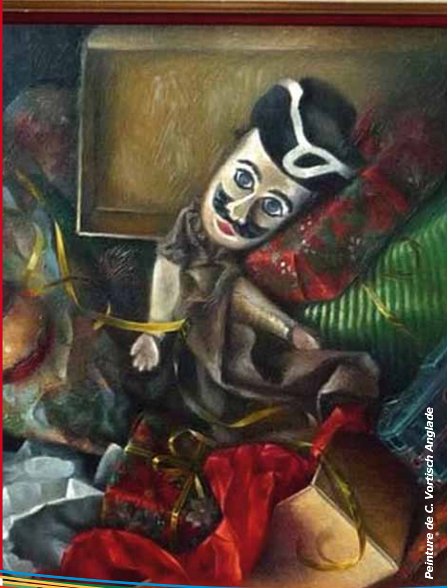
Peinture de C. Vortisch Anglade

Contact : 01.60.63.39.55 nadinerentz@aol.com