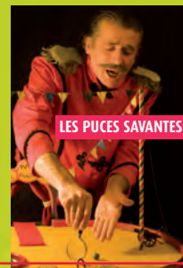
LES PUCES SAVANTES