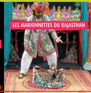
LES MARIONNETTES DU RAJASTHAN